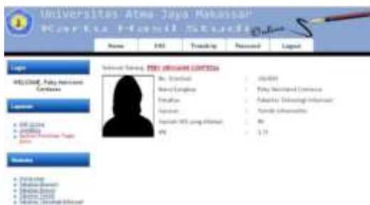
Gambar 2. Tampilan Pengantar Aplikasi di Kios Akademik

Aplikasi Penulisan Tugas akhir diimplementasikan di dalam khs online Universitas Atma Jaya Makassar yaitu http://khs.uajm.ac.id yang kemudian akan dapat diakses oleh mahasiswa Fakultas Teknologi Informasi.