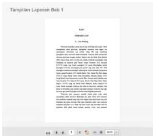
Gambar 9. Tampilan Laporan Tugas Akhir Bab 1

Evaluasi pengujian aplikasi penulisan tugas akhir dilakukan melalui simulasi pemasukan data tugas akhir dimulai dari judul sampai dengan data proposal judul, tugas akhir dan jurnal serta melibatkan langsung dosen dan mahasiswa yang melakukan pengisian wawancara yang disiapkan. Dari hasil wawancara didapatkan beberapa penilaian responden terhadap 3 hal yaitu adanya kemudahan dalam penggunaan aplikasi, struktur dan pengurutannya sesuai dengan format penyusunan tugas akhir mahasiswa dan pengolahan data masukan yang dilakukan oleh User atau mahasiswa dan asas manfaat terhadap hasil pengolahan data masukan yang menghasilkan Laporan Tugas Akhir. Hasil simulasi dan analisa uji kesahihan didapatkan bahwa aplikasi yang dihasilkan memenuhi prinsip kemudahan penggunaan dan hasil pengolahan data masukan sesuai dengan landasan serta meminimalisasi tingkat kesalahan mahasiswa dalam penulisan tugas akhir.