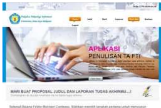
Gambar 6. Tampilan Awal Mahasiswa