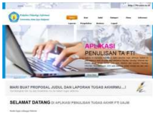
Gambar 5. Tampilan Awal Admin