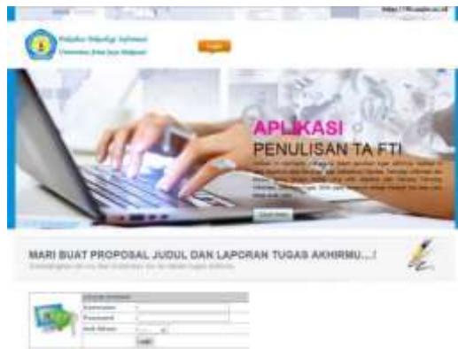
Gambar 4. Tampilan Login Awal