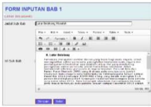
Gambar 9. Tampilan Form Input Tugas Akhir Bab 1

Tampilan Form Input Tugas Akhir Bab 1 terdiri dari beberapa bagian subbab yaitu Latar Belakang, Rumusan Masalah, Batasan Penelitian, Tujuan Penelitian, Luaran yang diharapkan, Manfaat Penelitian dan Kerangka Pikir. Begitupun dengan Tampilan yang terdapat pada Bab 2 memiliki subbab tersendiri, selanjutnya sampai pada Bab 5.