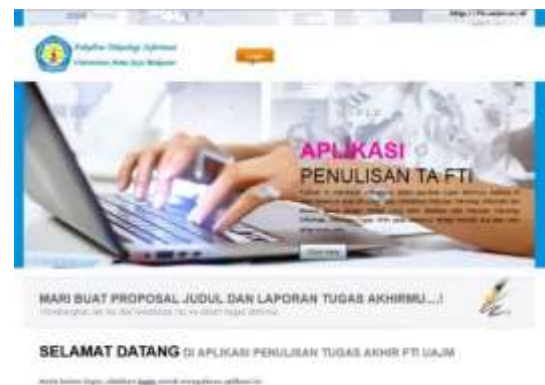
Gambar 3. Tampilan Utama

Tampilan Utama, disediakan menu Login bagi Admin maupun mahasiswa yang bertidak sebagai user.