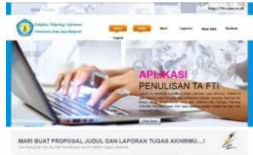
Gambar 7. Tampilan Judul untuk menu Proposal Judul

Tampilan menu Judul penelitian, mahasiswa yang telah login pertama tama memasukkan usulan judul yang akan digunakan untuk tugas akhir. Usulan Judul dapat dimasukkan lebih dari satu judul. Mahasiswa dapat menambahkan dengan memilih menu tambah judul.