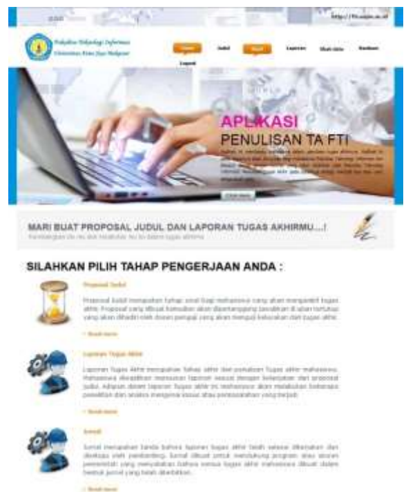
Gambar 8. Tampilan menu start

Setelah mengisi judul mahasiswa melangkah ke langkah selanjutnya yaitu di menu start. Menu start terdiri dari 3 langkah yaitu Menu Proposal Judul, Laporan tugas Akhir dan jurnal. Menu Laporan Tugas Akhir dan Jurnal hanya dapat diakses apabila menu proposal judul telah selesai dikerjakan.